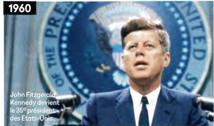
John Fitzgerald Kennedy devient le 35 e président des États-Unis.

Pour vos recherches : vous pourrez dénicher sur la toile un porto vintage 1960 de la maison Burmester. Ses vins sont généralement de style souple et suave. Ou un Fonseca, plus profond et viril. En Espagne, le classique et intemporel Vega Sicilia est une valeur sûre de la Ribera del Duero.