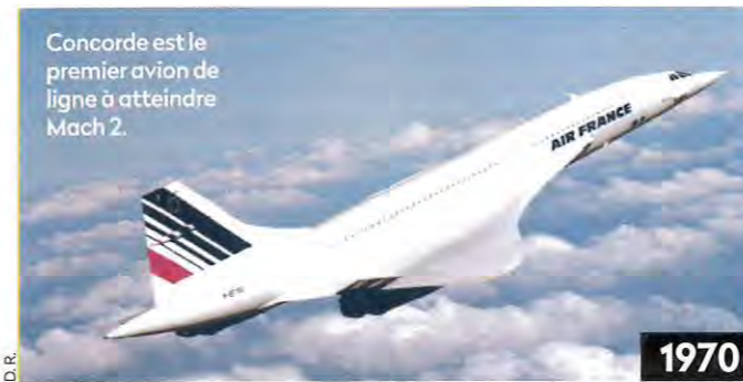
Concorde est le premier avion de ligne à atteindre Mach 2.