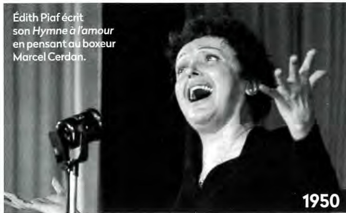
Édith Piaf écrit son Hymne à l'amour en pensant au boxeur Marcel Cerdan.