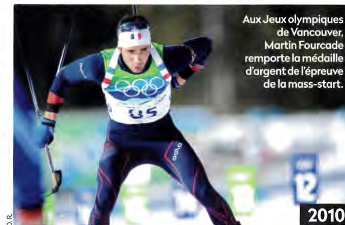
Aux Jeux olympiques de Vancouver, Martin Fourcade remporte la médaille d'argent de l'épreuve de la mass-start.