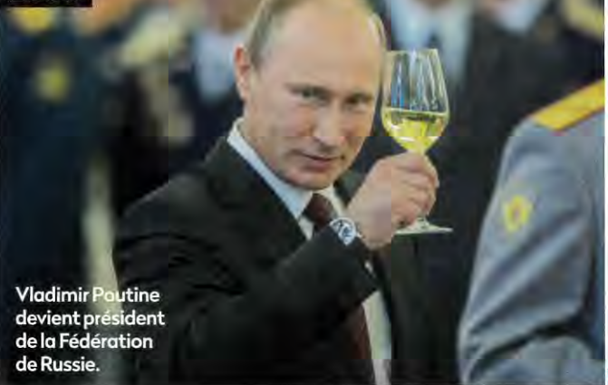
Vladimir Poutine devient président de la Fédération de Russie.